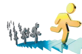
Competencia por mérito