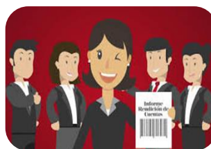
Rendición de Cuentas