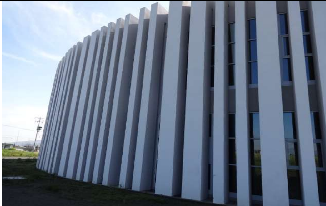
FACHADAS EXTERIOR E INTERIOR

“2017. Año del Centenario de las Constituciones Mexicana y Mexiquense de 1917”