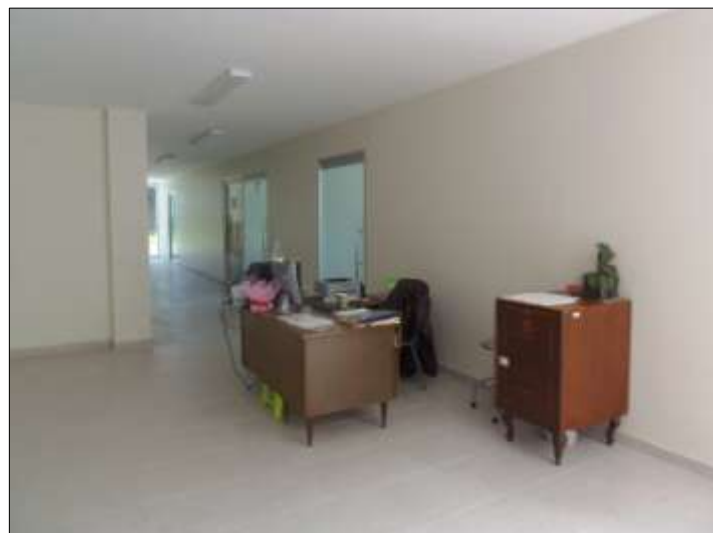
ÁREA DE RECEPCIÓN.