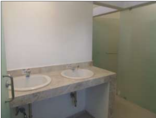
BAÑOS DE MUJERES.