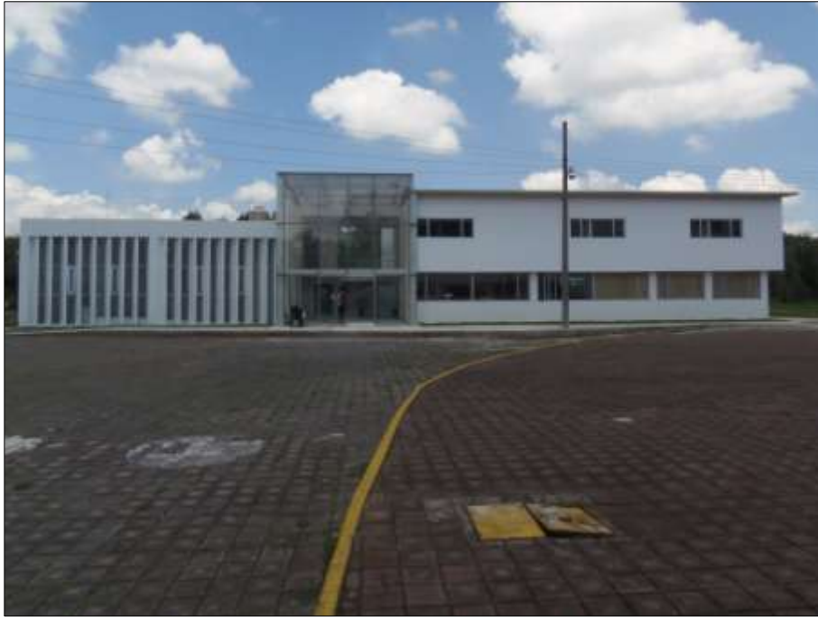
FACHADA PRINCIPAL DEL CENTRO MÉDICO.

“2015. Año del bicentenario Luctuoso de José María Morelos y Pavón”