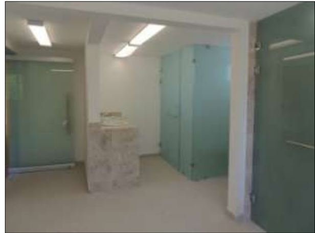
BAÑOS DE HOMBRES.