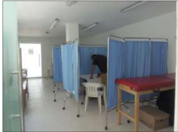
ZONA DE FISIATRÍA.