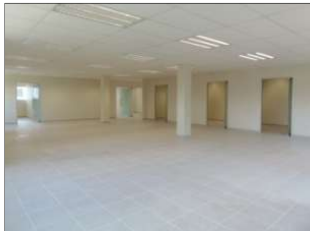
ZONA DE CONSULTORIOS Y ÁREA DE EVALUACIÓN.